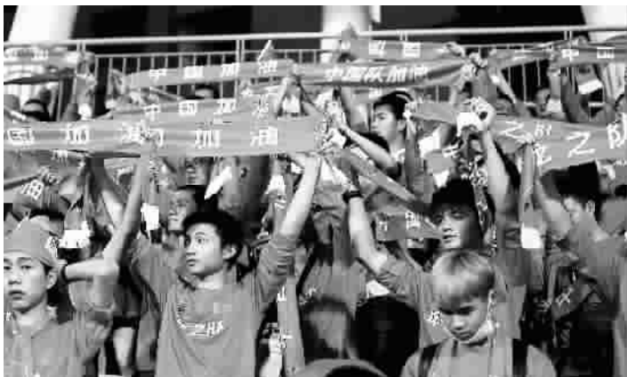
足协敞开大门,等着各路人才为中国足球添砖加瓦

这次招聘包括22个岗位,涉及多个核心部门,是中国足协迄今为止最大规模的一次公开招聘。想要去足协工作?那就赶紧去下一份报名表试试吧!