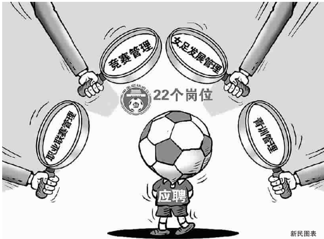
新民图表 制图 董春洁