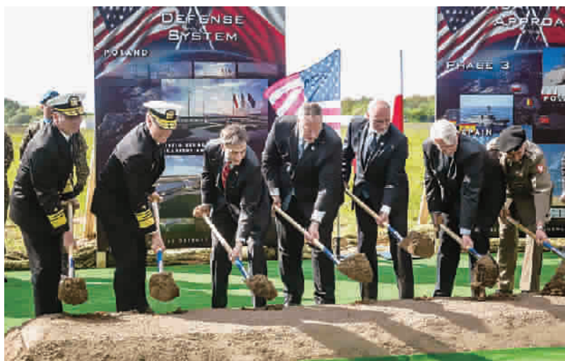
美国在波兰北部的反导基地破土动工