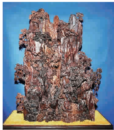
黄花梨木雕《赤壁怀古》

这件木雕不仅材料弥足珍贵，雕刻创作也独具匠心，蕴含着极为丰富的想象空间，将东坡先生《赤壁怀古》的内涵，表现得淋漓尽致，让时间在那一刻定格。