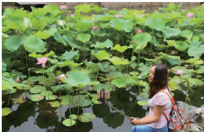
古猗园内,一池红建莲开得正好,游客欣赏之余玩起了自拍

相比之下,静脉药物配置机器人配置空间全密闭,洁净度达到百级并形成负压,具有质量稳定、防护严密、用药安全等特点,不仅保证了患者的用药安全,也能有效保护医护人员。