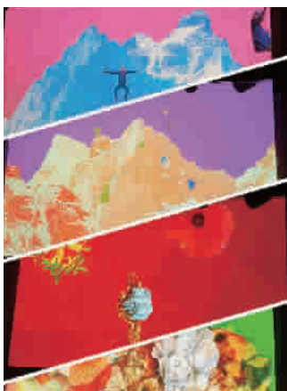
剧场里的艺术跨界让观众陶醉了