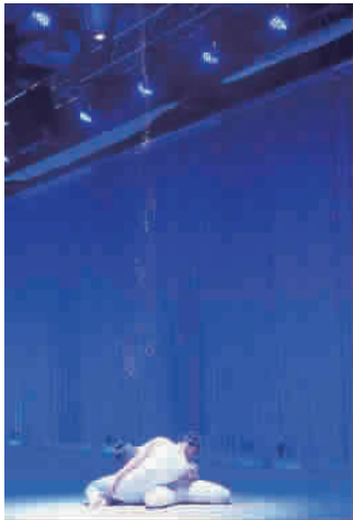
美丽的金沙流淌在舞者的身上

为何跨界艺术在德国如此红火?这得益于近年来德国一系列的刺激政策。像2007年提出“文化创意经济行动”,随后成立创意经济职能中心为大家牵线搭桥;还成立电影促进基金、音乐倡议行动组,举办音乐舞蹈节、创意设计节等;在鲁尔区等旧工业区改造中,船头指向文化创意,受益的鲁尔区也获得了“欧洲文化之都”的称号。