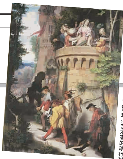
《玫瑰或艺术家的旅行》