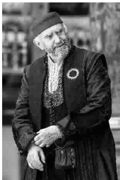
乔纳森·普雷西扮演的夏洛克

过第48届戛纳电影节最佳男主角、两度托尼奖得主乔纳森·普雷西。目前,《威尼斯商人》正巡演至美国林肯中心、肯尼迪表演艺术中心。而东艺的5场演出票房已近乎全满。