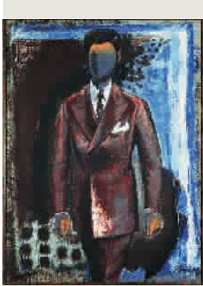
■ 《穿西装的男人》,布面油画,1976

人体、水壶、战士的钢盔、男人、小孩、树林,反复出现的物象和被压低的色调,如同经过混响处理的音律,带给人一种混沌而又充满冲击力的撞击感。吕佩尔茨拒绝将自己的作品标签化、符号化,也从不进行任何主题创