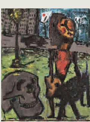
■ 《女人和狗》,布面油画,2003