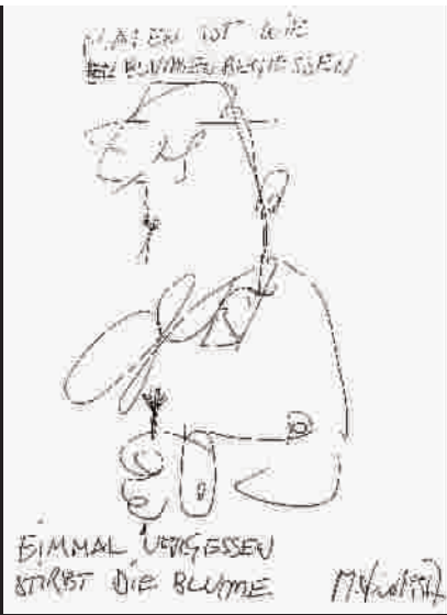
■ 吕佩尔茨的自画像及为本报读者的题字,艺术之花需要每日浇灌。