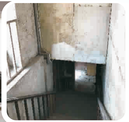
▲ 居民日常改走消防通道 ▲ 2楼以下主楼梯被地板完全封闭