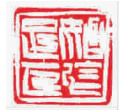
各式皮鞋水陆两用，元宝匿迹，路上的轮胎多起来。戊子秋夜临窗遐想因记，慰祖。时沪上连日暴雨，报载乃百年一遇。