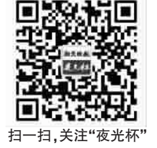
扫一扫，关注“夜光杯”