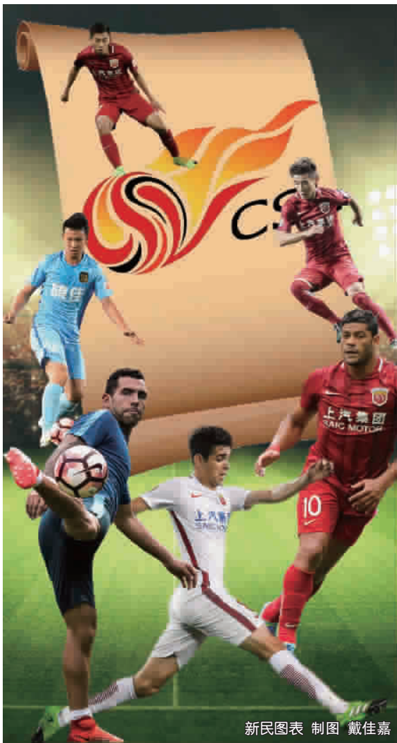
新民图表 制图 戴佳嘉

昨晚，中国足协在国家体育总局官网发布了这样一篇文章：《推动十八条管理措施落地 规范职业联赛有序发展》。而在此之前的24日深夜，他们做出了两个足以令中国足坛地震的决定：从今年的夏季转会起，限制高价引援；从2018赛季开始，中超中甲U23球员登场人数必须与外援登场人数相同。顿时，一石激起千层浪，对中国足协新政的各种吐槽扑面而来。