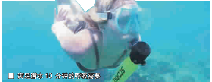
■ 满足潜水10分钟的呼吸需要

在夏天,光是游泳冲浪已经无法满足我们的好奇心了,带上 SCORKL 绝对让你深切感受大海深处的魅力,尽情体验潜水的乐趣。目前,SCORKL 便携氧气罐已经开始在众筹平台 Kickstarter 发起众筹,目标为3万澳元(约合15万人民币)。早鸟起价99澳元(约合507人民币),“氧气管+转接头”的套装价格为199澳元(约合1019人民币),“气罐+转接头+打气筒”的套装价格为398澳元(约合2038人民币)。如果一切顺利的话,10月可以出货。 李忠东