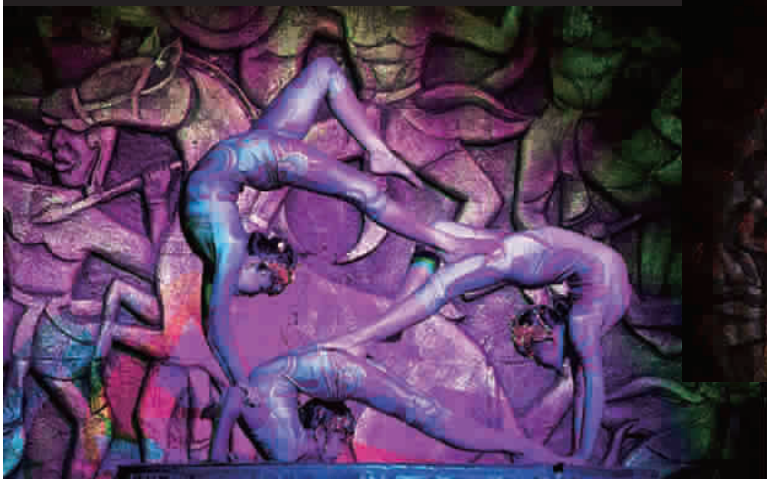
■ 由中柬两国艺术家共同编创的情景大戏《吴哥的微笑》在柬埔寨公演