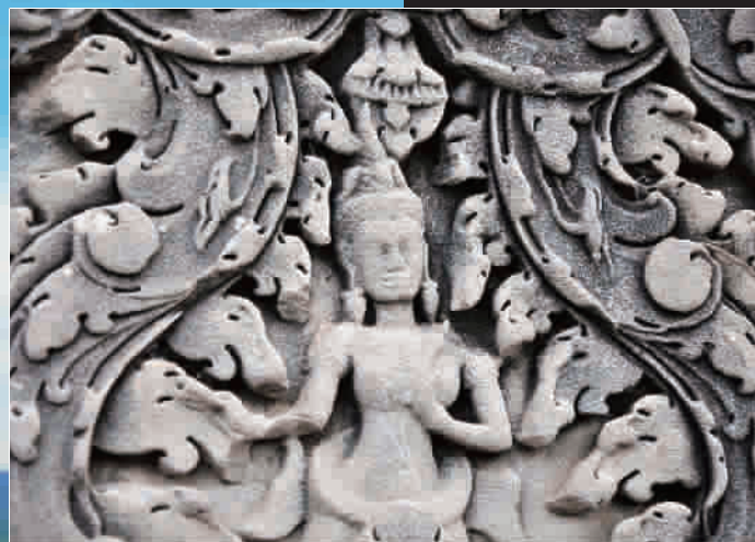
■ 联合国教科文组织于1992年将吴哥古迹列为世界文化遗产