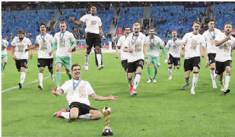
德国二队喜获联合会杯冠军

新一期国家队排行榜上,赢得联合会杯冠军的德国队升至第一。有球迷调侃:“世界前三是德国队、德国二队和德国U21队。”的确,联合会杯的胜利,是德国足球的胜利。勒夫时代注重青训、梯队整体联动的足球理念和战略,在巴西世界杯后不断结出硕果。