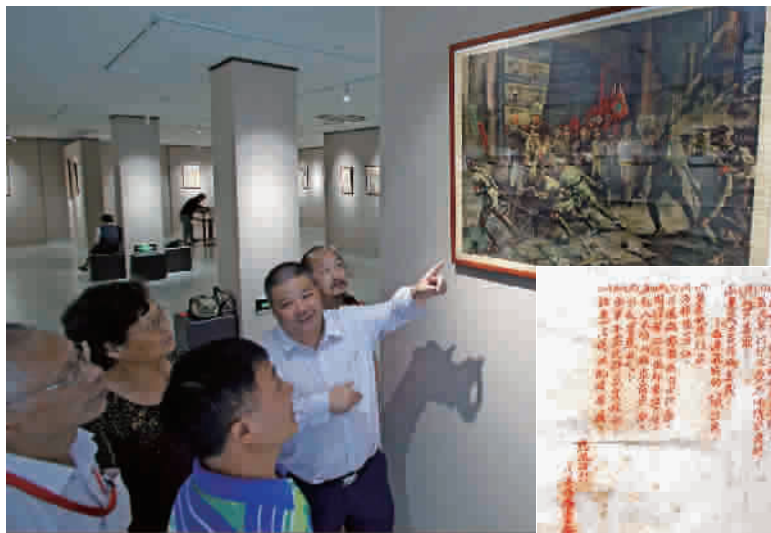
■ 观众在参观“军旗峥嵘”红色收藏展

年轻的参观者在影像资料等展品中找到了祖辈、父辈或同辈的影子。1950年，在皑皑白雪中跨过鸭绿江的中国人民志愿军是我们的祖