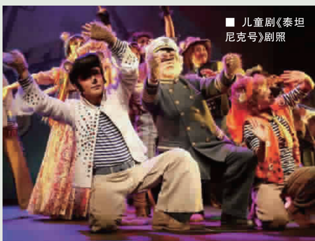
■ 儿童剧《泰坦尼克号》剧照

该展览展出的历史文献、实物藏品、艺术资料等2000余件展品，均来自于民间收藏。为吸引更多小观众，明天和8月5日，现场将举办两场主题手工制作活动。本报记者 肖茜颖