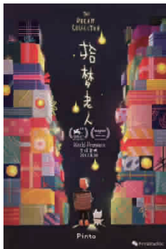
■ 动画片《拾梦老人》海报

据介绍，《拾梦老人》讲述的是一个捡垃圾的老头与他乐观积极的小狗，在垃圾场中日复一日拾捡人们丢弃的梦想的故事。观影过程中，观众将完全置身于故事中，甚至能走近观看主人公的一举一动。尽管《拾梦老人》的画风具有“国际范儿”，但片中不乏许多中国观众熟悉的元素。《拾梦老人》的导演米粒曾参与制作《大圣归来》《小门神》《魁拔》等动画电影。