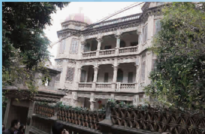
■ 黄氏小宗也是鼓浪屿最早和西方人交流的场所