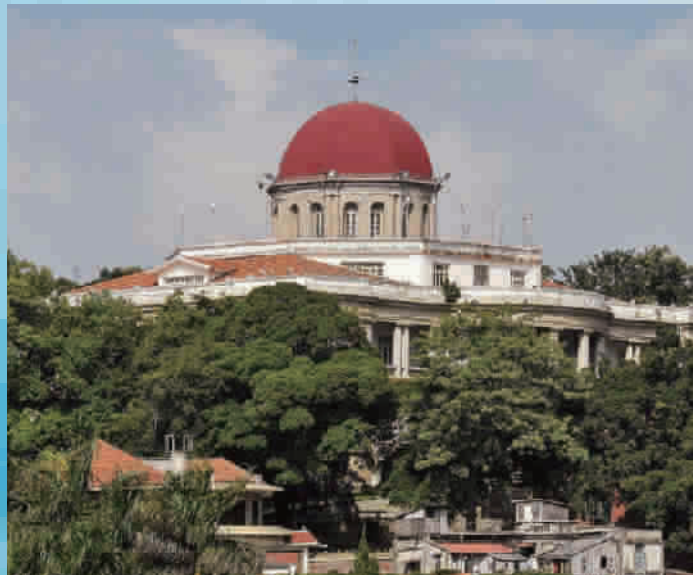
■ 汇丰银行公馆旧址