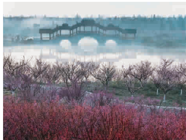
■ 海湾森林公园梅花节之探香桥