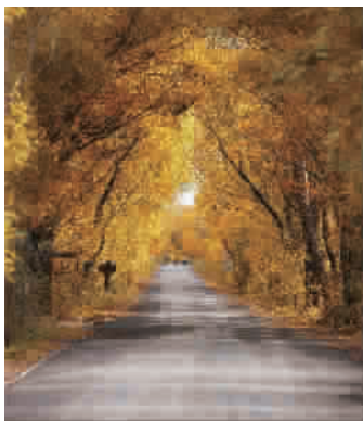
■ 花马寺国家森林公园

当长白山的山头白雪皑皑,当宁夏的沙漠公园金沙漫漫,当张家界的奇山轻雾环绕,你还在钢筋水泥森林里匆匆赶路吗?那些想爬的山、想戏的水、想呼吸的清新空气,天地广阔你想要去哪里?