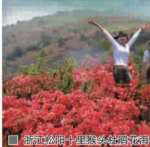
■ 浙江松阳十里猴头杜鹃花海