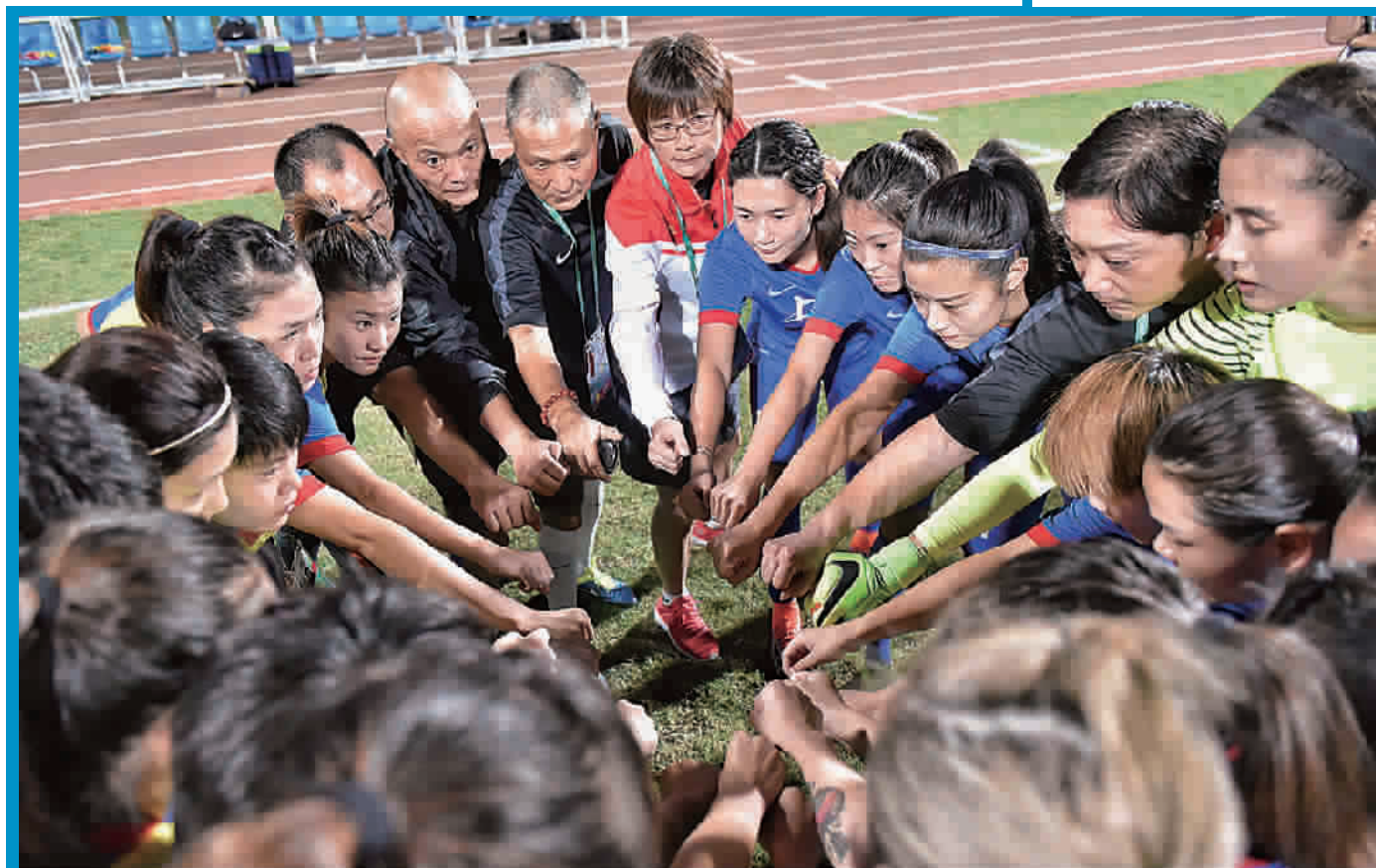
■ 上海女足众志成城