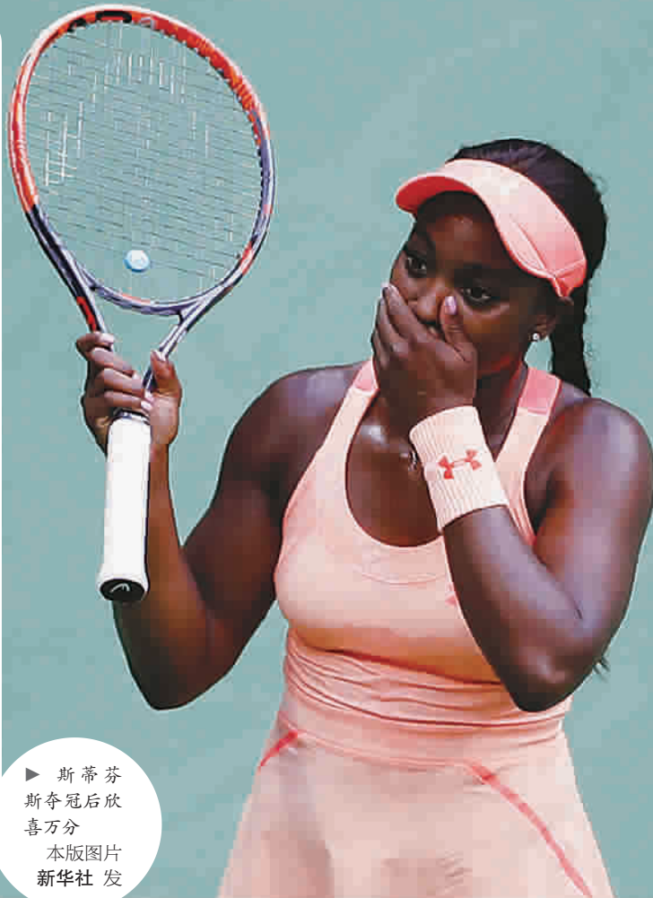
▶ 斯蒂文斯夺冠后欣喜万分