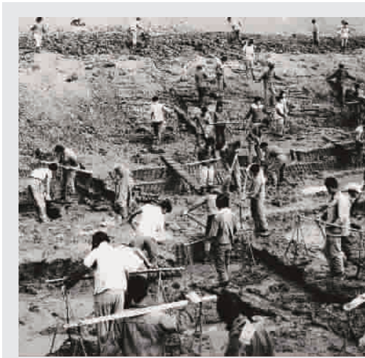
知青农场“开河”的情景