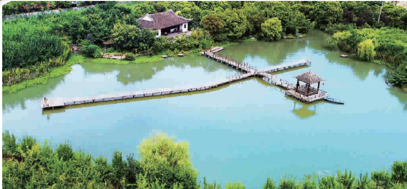
嘉北郊野公园还原市民记忆深处的乡情野趣 本报记者 刘歆摄