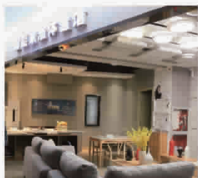
百家宜三楼智能软装及家居体验馆吸引了众多时尚、年轻客群。

据了解,在聚通装修的客户,只要关注“聚通工程管家”的微信号,并绑定自己的手机号码,即可轻松使用。客户打开工程管家的微信服务号,即可以看到设计图纸、装修进度、材料跟踪、远程监控、付款明细及我要评价等内容图标,点击图标即会呈现相应的服务的内容;图纸、进度图、材料清单、工地照片等,让客户足不出户即可全面了解自家装修的进展,并对服务情况进行点评。其中客户的评价内容都将直接影响到工作人员的绩效考核。