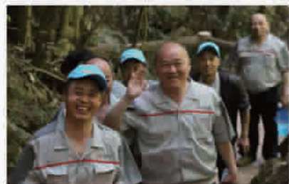
常年埋头在工地上的工人师傅们难得有机会出门郊游。笑脸中满含了淳朴和真诚。

当前互联网时代,消费越来越直观和透明,可否借助互联网统一监督的手段,使客户的利益再度加强保障性,对此,聚通研发中心的甄总监介绍:“我们于2015年就自主研发了‘工地管家’互动程序,客户在微信上可以及时便捷地了解到自家装修的进度和付款明细等,收费情况十分透明,让消费者免除了后顾之忧。”