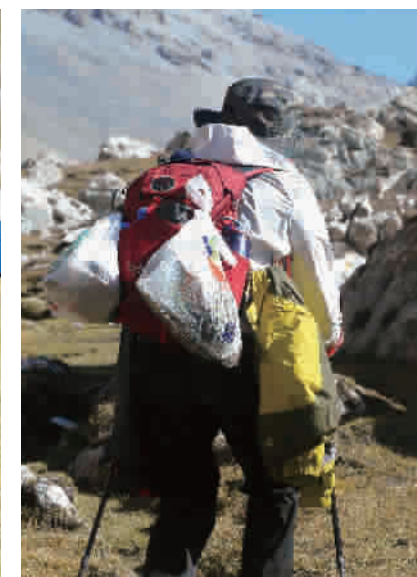
为了保护大自然的环境,在山里产生的所有不可降解的垃圾都要背出山外