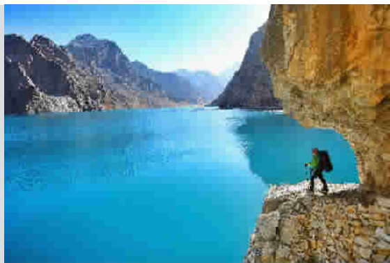
在天堂湖的老虎嘴留影,几乎是每个来到此处的驴友必做之事