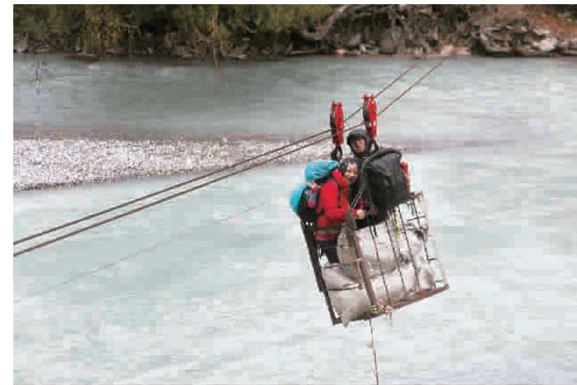
过阔克苏河必须使用简陋的溜索,这已经比前几年单人用主锁挂在绳索上过河条件好不少