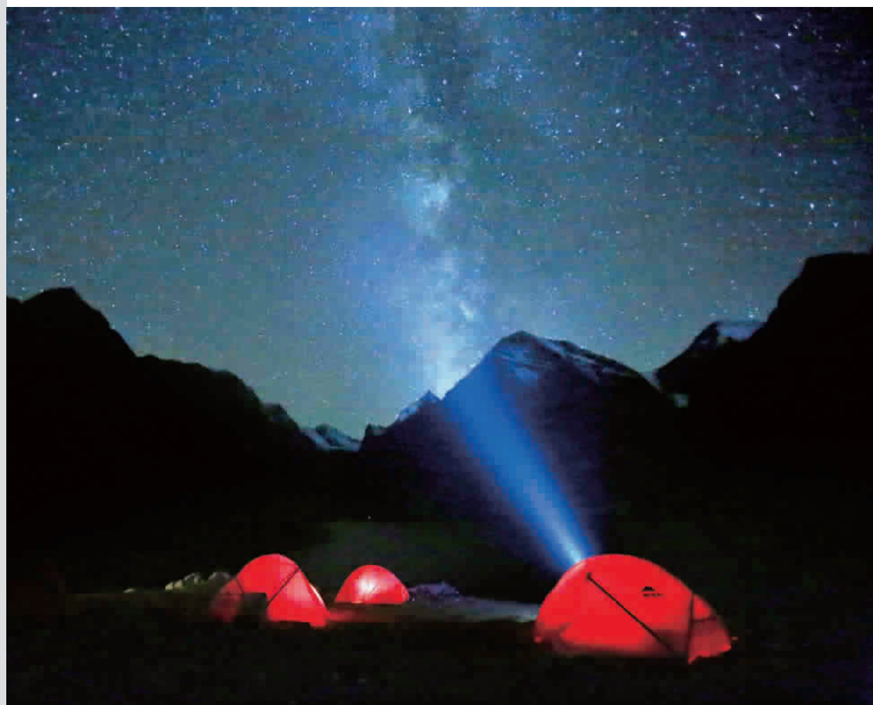
乌孙古道属于无人区,远离都市的光污染,每晚都能看到满天繁星、迷人银河