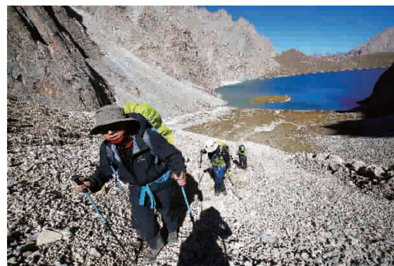
阿克布拉克达坂分为多段,大部分为碎石坡且坡度陡,对体力是一大考验