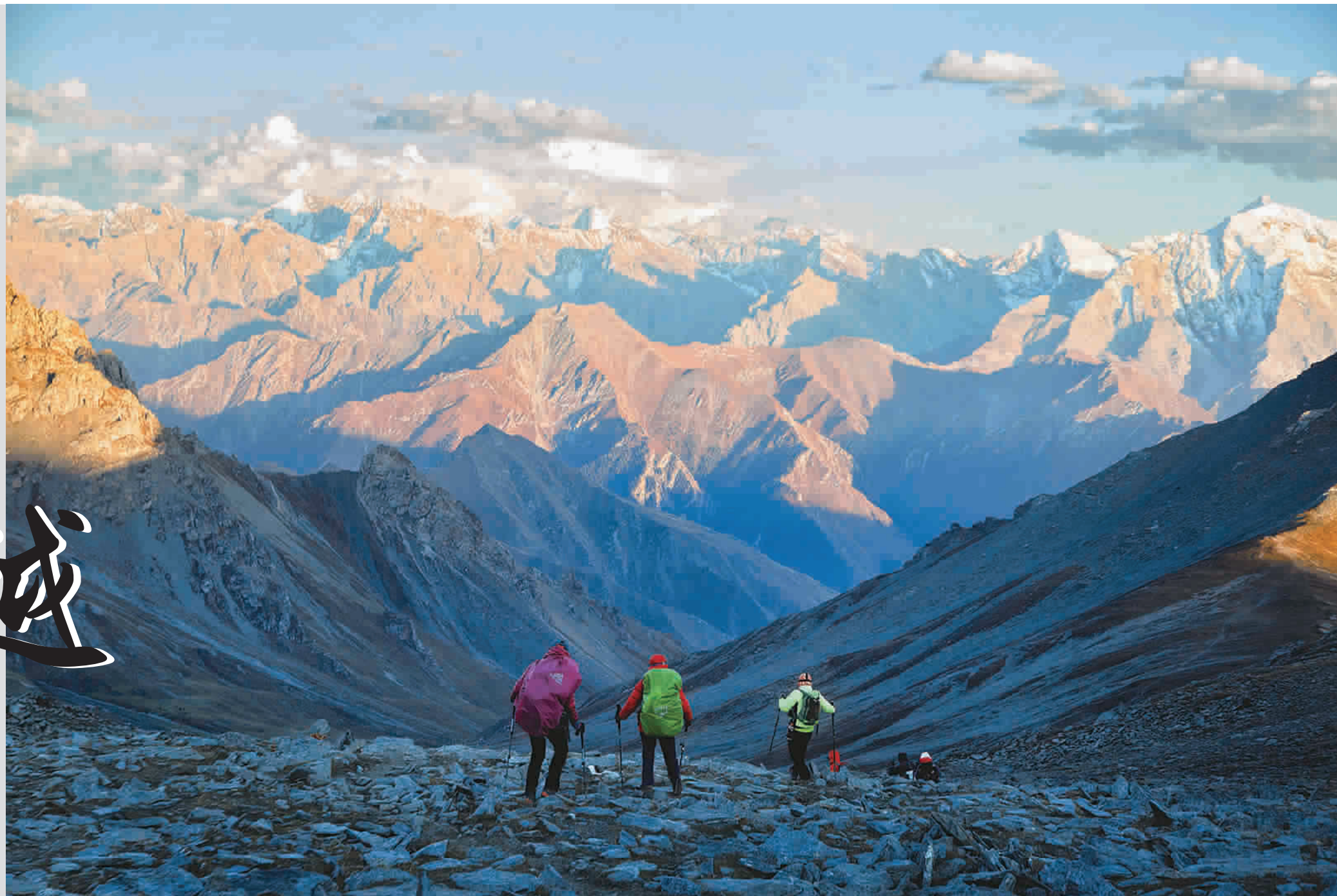
翻过包扎墩达坂,傍晚的夕阳映照着山峰,暗金色的峰尖和阴处深蓝色的山搭配得如此完美