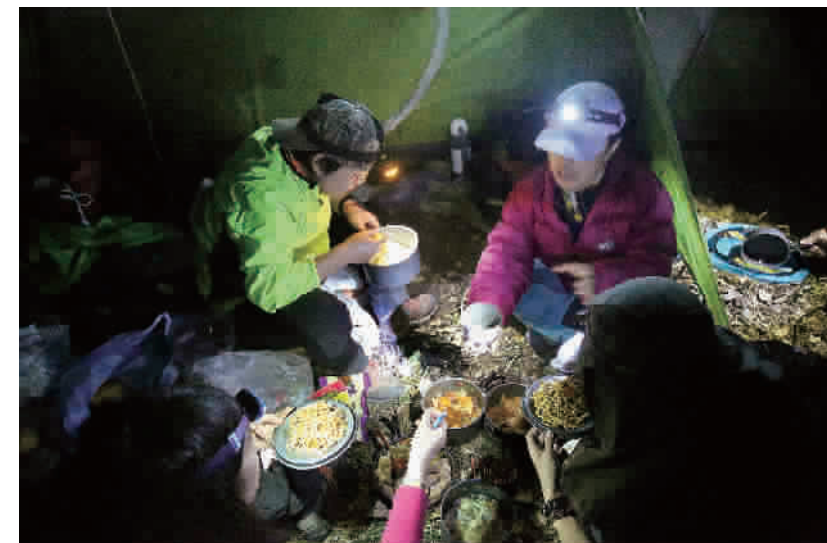
徒步了一天,最开心的就是晚上围坐在帐篷前,煮一碗热面,吃着大家背来的各种菜,一天的劳累便已抛到脑后