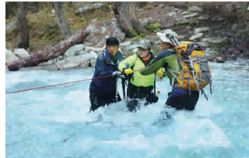
由于水流湍急,向导和领队正在帮助队员涉水过河。在拉绳索过河的时候,要像拔河那样拉直拉紧,并用胳膊夹住绳子,才能保证被河水冲击的时候,可以始终贴着绳子往前走,保持身体平衡