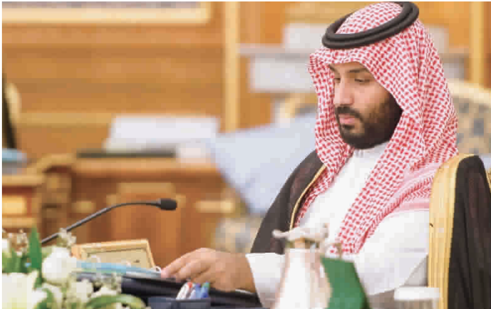
沙特王储小萨勒曼