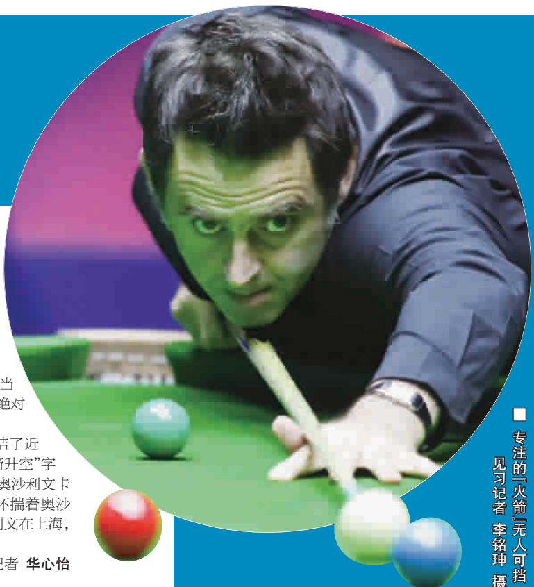
■ 专注的“火箭”无人可挡