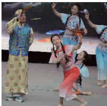
本报记者肖茜颖文 胡晓芒摄

海门古名东洲，成陆于唐代末年，于958年设立海门县，至今已有1000多年历史，被文化部命名为“中国民间文化艺术之乡”。本次展示周主办方希望以沪展演交流为契机，进一步加强两地的文化交流，并邀请上海的院团去海门“做客”。