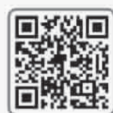
扫描二维码，查看结果