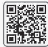
扫描二维码 找“夫妻脸”对象

就要跨年了，单身们还想过一个人吃饭，一个人看电影，一个人逛街的苦日子吗？赶拿起手机，扫描二维码，加入微信交友区，找个有“夫妻脸”的对象一起跨年吧！