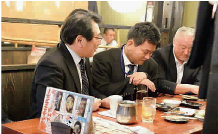
▲日本政府推动工作方式改革,要求员工减少加班,按时回家 不少日本男性下班后不愿回家,长时间逗留在外