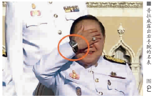
普拉威露出右手腕的名表

副总理年收入不到100万泰铢，普拉威却至少有15只名表，总值可能超过2000万泰铢。许多民众都很好奇，以一名年收入不到100万泰铢的政府官员，如何拥有这么多名贵手表。根据泰国审计部公布的公务员薪资表来看，泰国总理巴育月薪才75590泰铢。