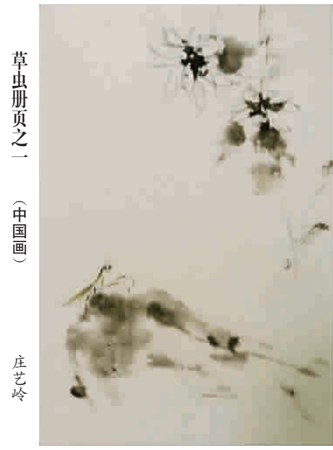
草虫册页之一 (中国画) 庄艺岭

高却枝叶茂密的“大红袍”茶叶拍卖出了十八万元的天价。目前“大红袍”早已成为武夷山岩茶的代名词。