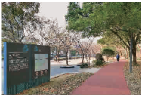
■ 宝山区友谊路绿道