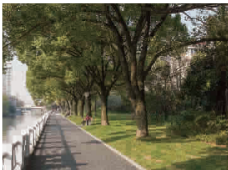
■ 闵行区横沥港绿道