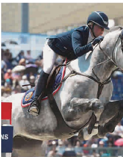
■ 环球马术冠军赛将五度登陆申城 图 TP