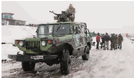
■ 乌军开始获得美制武器