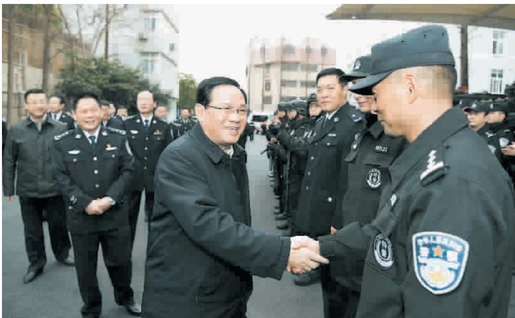
除夕下午,李强检查城市安全保障工作,慰问坚守岗位的武警官兵、公安干警