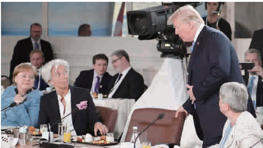
■ 特朗普9日出席G7峰会早餐会时姗姗来迟