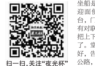
扫一扫，关注“夜光杯”

接触到玩核桃是在几年前了。一次去一个朋友家做客，看到他手里在玩两枚核桃，来回搓动着，声音像一首悦耳的曲子，红彤彤的，闪着光芒，远远看上去，真像一对玉核桃。那一刻，很想拿到手里仔仔细细地欣赏一下，把玩一下。刚开始，还有些不好意思，时间长了，话说得也算投机，便对他说了我的愿望，他毫不迟疑，立马拿给我，还说，这对核桃他已经把玩了几年时间了，爱若珍宝。 拿在手中，我学着朋友的樣子，搓动了几下，感觉特别美好。也就是这一搓，从此就爱上玩核桃。 回到家，立即购买了一对。我的那对叫做“满天星”，刚买回来的时候，锋芒毕露，转也转不动。为此，我曾请教过一个玩玩的哥们，他说，这种核桃想玩好了，是需要时间的，千万不能心急。而且，玩的不仅是核桃，更是你的性子。如果你给别人玩好了的核桃，享受不到那种过程，反而没意思了。 听了哥们的话，我每天没事的