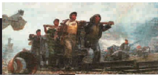
■ 陈逸飞、魏景山《开路先锋》1971