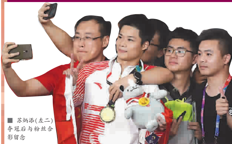
苏炳添(左二)夺冠后与粉丝合影留念

望着他远去的背影，有同行感慨说：“真希望他能再多跑两三年。”这又何尝不是所有中国体育迷的心声？ 关尹