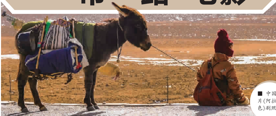
中国影片《阿拉姜色》剧照

上海国际电影节(SIFF)积极响应习近平总书记2013年秋提出的“一带一路”倡议,历经设立“丝绸之路”影展单元、“一带一路”国际影展单元、“一带一路”电影周,通过签订战略合作协议、交流合作机制备忘录,成立“一带一路”电影节联盟等举措,逐年提升合作能级,不断扩大合作范围,将“一带一路”落实为贯穿每届电影节始终的办节主题,促使越来越多国家的电影节和电影机构,正在从当初的合作意向转化为如今的切实行动。经过5年的建设,在“一带一路”为世界开启发展新航程的今天,从今年秋天起,上海国际电影节全新启动“一带一路”电影巡展机制。