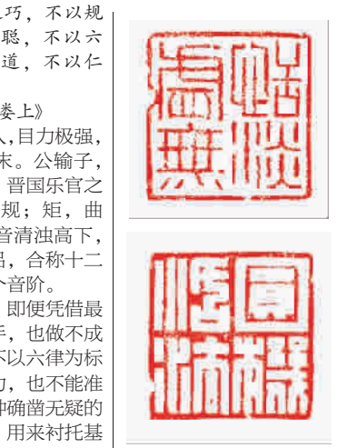
恬淡虚无 圆机活法 ——中医用典 张屏山 作

不知是不是因为从事的工作一直与孩子为伴，我从来都没有觉得自己已经38岁，就这样懵懵懂懂地闯进了中年。此时的我，才真切地体会到什么叫作“人到中年”：双方老人年过七旬，时不时头疼脑胀；老公在外地工作，每个月只能回来一次；单位工作多，压力大，常常是五加二、白加黑；孩子刚刚上了小学，作业、课外班，弄得我团团转……生活、工作就这样铺天盖地地席卷而来，几乎要将我淹没。一度，我也曾濒临崩溃。我常常很焦虑，很想把每一件事都做好，做到极致，却又常常力不从心，分身乏术。最重要的是，在日复一日的忙碌中，我觉得自己失去了前进的目标和动力，只剩下了浑浑噩噩。一次，高中同学聚会，大家纷纷谈到了自己这个阶段的困惑与矛盾，大致相同，都在或多或少地拧巴着。大家笑称，我们正在面对中年危机。每个人采取的解决方法不尽相