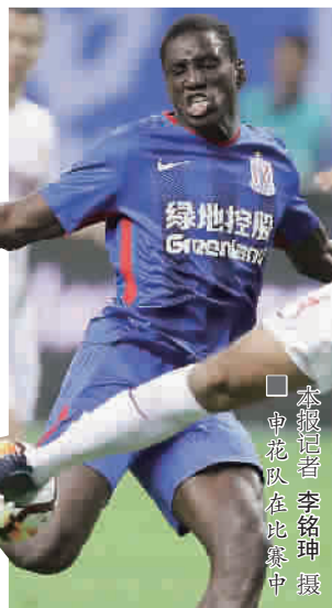
申花队在比赛中