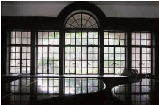
霖生医院旧址门厅

1956年，上海医院改为公立。1958年9月改为徐汇区结核病防治所。目前成为一家私人会馆。