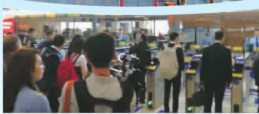
▲ 首批搭乘港珠澳大桥穿梭巴士的乘客在珠海口岸自助通关