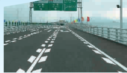
▲ 上午,本报记者搭乘从珠海到香港的首发巴士