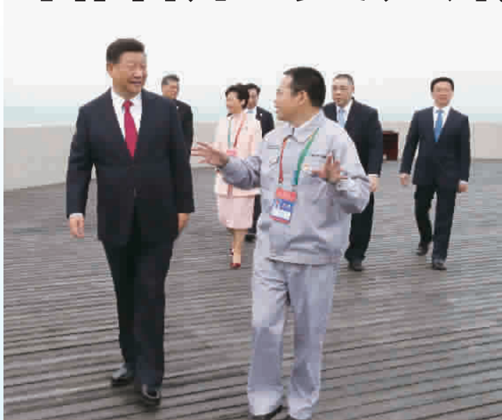
■ 昨天上午,习近平在港珠澳大桥东人工岛察看大桥全貌