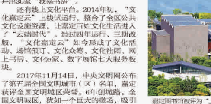
嘉定图书馆被评为“上海最美图书馆”，不少市民因此慕名而来。