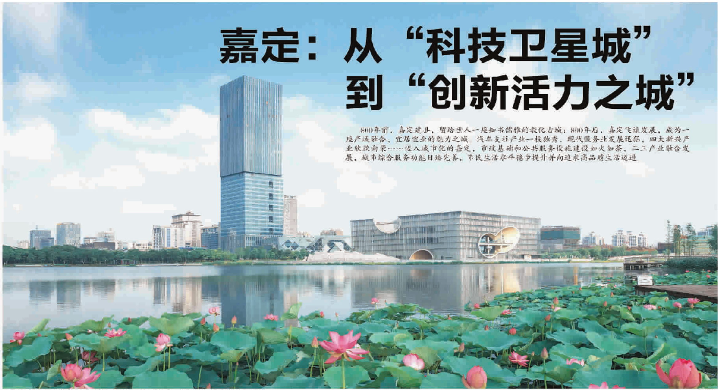
嘉定新城是上海重点建设的三大新城，“千米一湖、百米一林、河湖相串、荷香满城”宜居宜业

导的礼乐文明活动，并非阳春白雪、曲高和寡，而是贴近民心、深入里巷。如今，弘扬礼乐文明的嘉定正在重现焕发历史文化的能量，不仅为礼乐传“城”结出丰硕果实，也成为嘉定建设现代化新型城市的底蕴文化基因和重要助推器。