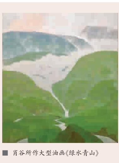
肖谷所作大型油画《绿水青山》

肖谷的作品形式是油画,因为创作的时间紧迫,他放弃了原先惯常所用的材料而采取了丙烯作为原料,在如何将传统审美与西洋绘画样式相结合的方式上,他做了很多探索与尝试,中国传统绘画中的图示因此成为他借鉴的最大源泉。从“四王”中王翬的华滋浑厚、气势勃发,到张大千泼墨山水的洒脱,谢稚柳晚年的缤纷浓郁,都可以在肖谷的“青山绿水间”窥见踪影。