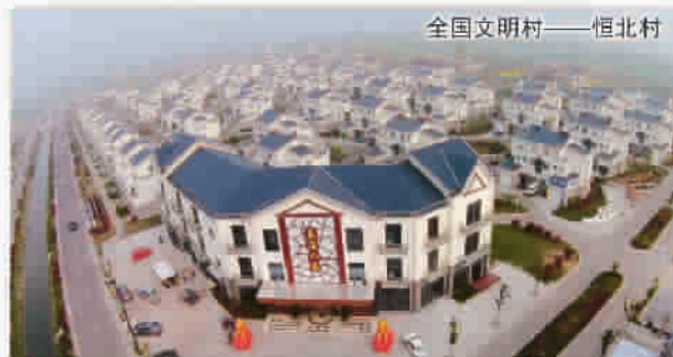
全国文明村——恒北村

作为沪上名副其实的“米袋子”“肉篮子”“菜篮子”，大丰聚焦沪中农业合作基地建设，实施农业标准化和全程化监管，被农业农村部确定为国家农产品质量安全县(区)创建单位。其中，“宝龙龙虾”被认定为“中农10+10”地理标志互认产品。光明食品集团在大丰已建有2.5万头申丰牧业和10个现代化猪场。如今，大丰已成为上海城外最大的优质农副产品生产加工基地，生产和供应上海15%的鲜奶、12%的优质大米、3%的淡水产品。