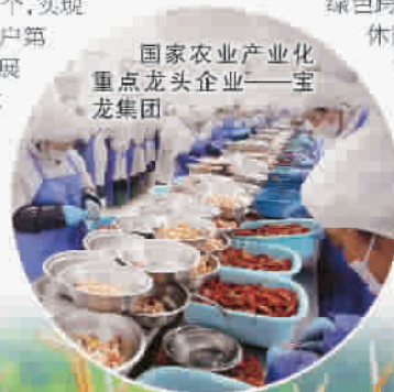
国家农业产业化重点龙头企业——宝龙集团

下一步，大丰将坚持以乡村振兴战略为引领，瞄准农业高质量发展新要求，把握农业绿色发展新理念，坚持“开放沿海、接轨上海，绿色转型、绿色跨越”新路径，主攻设施农业、休闲农业、特色产业，突出布局优化、品质提升、产业融合、精深加工等重点，努力打造成为上海农业科创成果转化基地、长三角优质农产品供应基地和生态旅游康养基地。诚挚邀请各界人士前来观光考察、投资兴业、共谋发展、共创未来！