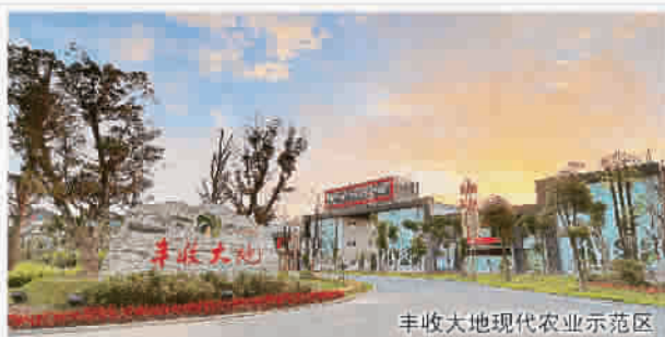
丰收大地现代农业示范区