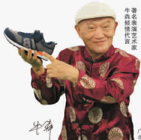
著名表演艺术家 牛犇倾情代言