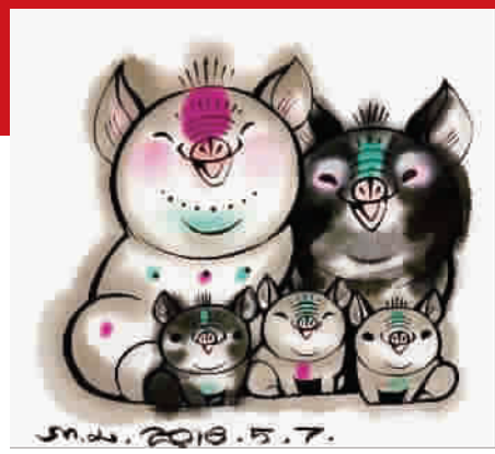
猪年纪念邮票图案

其实在十二生肖之中，圆滚福态的猪一直有着憨态可掬的“猪”设，是丰盈滋润生活的象征，历来都是设计师、创意人钟意的创作题材。猪年，在“猪”事大吉的氛围中聊一聊萌趣横生的猪设计，也是应景应季的雅事一件。