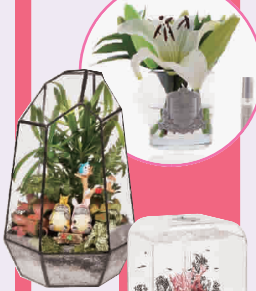
● DOROQ 苔藓盆景 280元(小) 380元(中) 480元(大)