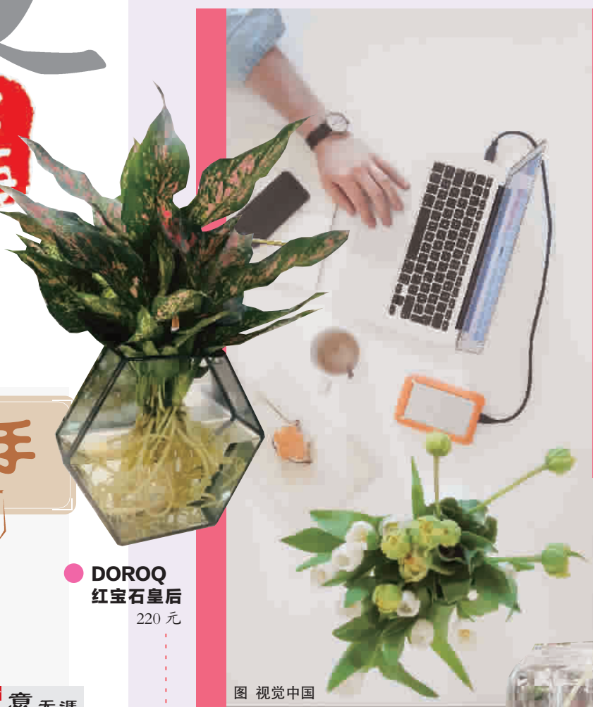
● DOROQ 红宝石皇后 220元

如今的桌面绿化可不再是一盆盆简单的绿植,或许称之为“微景观”才更为恰当。呆萌可爱的多肉盆景造型多样,各种来一个大拼盘简直“土豪”,苔藓盆景如同梦幻花园,还能把卡通小人藏在里面。蝴蝶兰过去是年宵花里的常客,迷你盆更显亭亭玉立,清新文雅。就连假花也来凑热闹,难得的是一缕幽香可以持续多年。你会选哪一个?