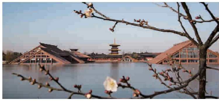
梅香广富林

冬日清冷,万物凋零,大街上路遇的行人也大多是面目肃然、行色匆匆,如此景物映入眼帘,更让这凛凛冬日平添了一份寒意。只是,冬日深处总还有一些属于春天的角落,那些冬天里的春天,宛如阳光消融的白雪,超脱了冰冻的世界,直抵心灵的深处。