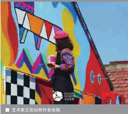
■ 艺术家正在仙桥村舍涂鸦