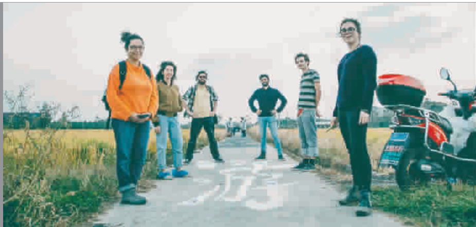
■ 仙桥村田间涂鸦 颇有印象派画风